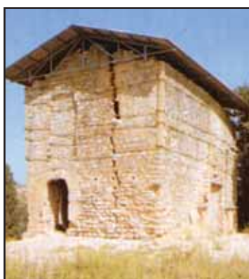
Vila-Rodona, columbario romano

Pero a lo mejor prefieren ir por carreteras y carreteritas, disfrutando de pueblos y paisajes, hasta llegar a la altura de Tarragona. De esta ciudad y su historia les hablaré en próximas ediciones.