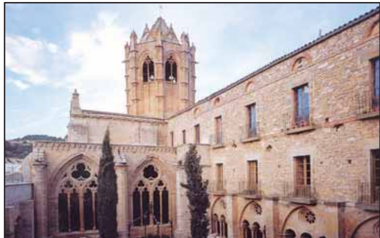
Santa Maria de Vallbona