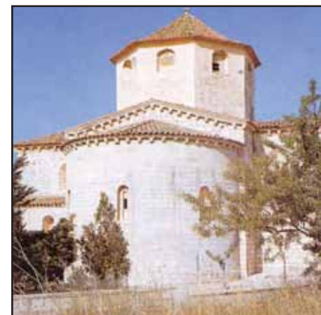
El Pla de Santa Maria, iglesia románica de San Ramón

Inside the church you'll find the beautiful sarcophagus of Pedro III, Jaime II and Blanca de Anjou, surrounded by lovely