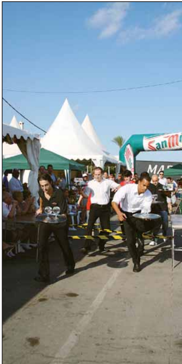
Carrera de camareros en Alcossebre / P20

Sexta edición de la Fira de la Caça i la Natura de Atzeneta / P34