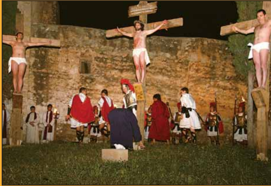
Cada año aumentan los visitantes para ver la escenificación de la pasión de Jesucristo, tan bien representada por nuestros actores locales.

y las múltiples actividades realizadas por la Asociación de Discapacitados.