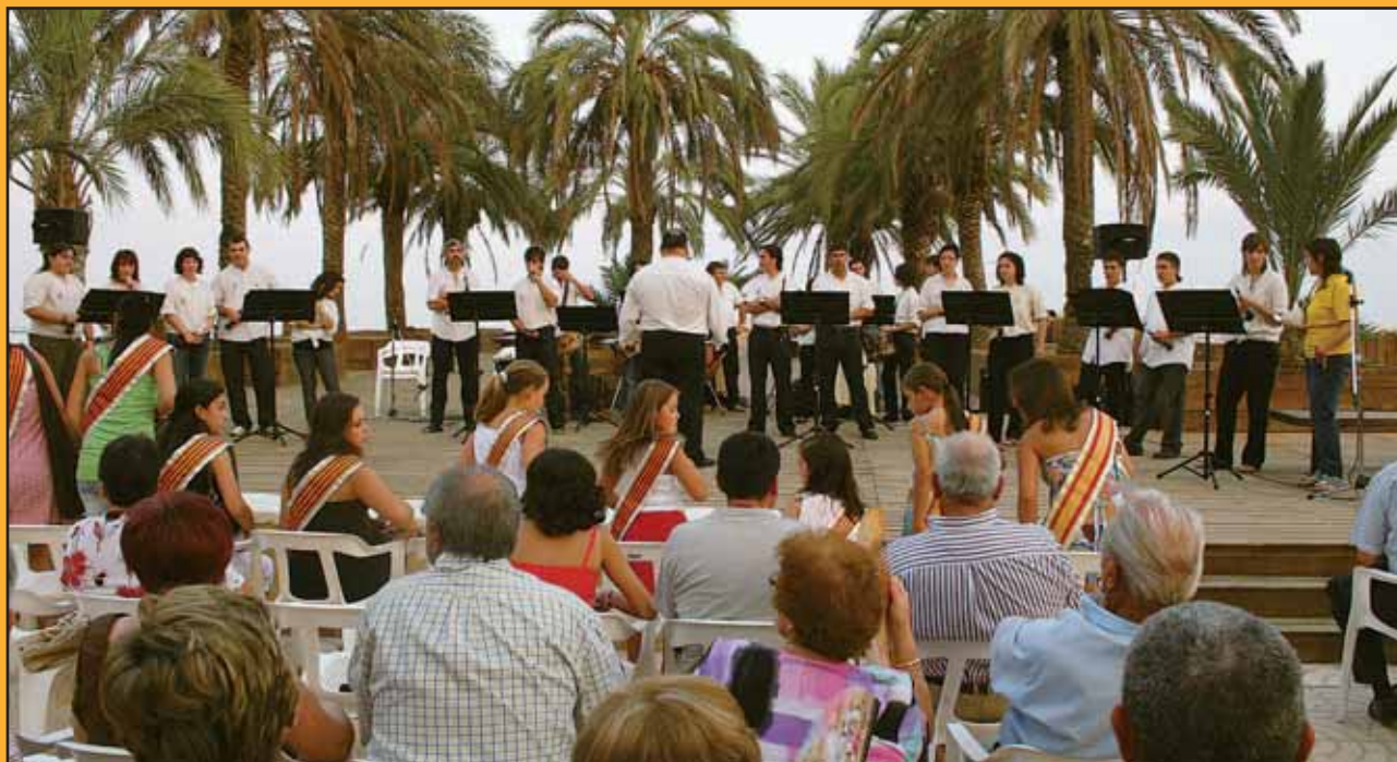
Imagen de la actuación dels Dolsainers durante el verano en la playa de Torrenostrà.