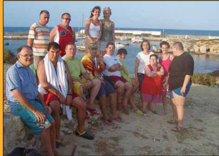
Los discapacitados disfrutaron al máximo de su viaje a Tabarca.