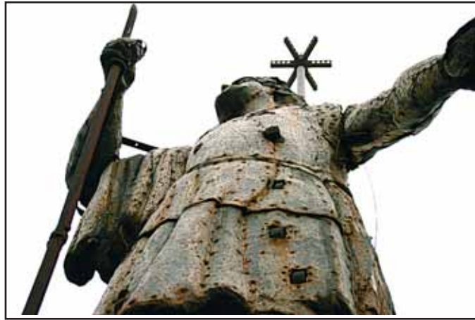
Imágenes de la estatua y la base antes y después de la restauración

El Ayuntamiento concluye la profunda restauración realizada al monumento