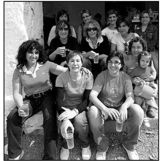
Les mes templeaes de El Mollet