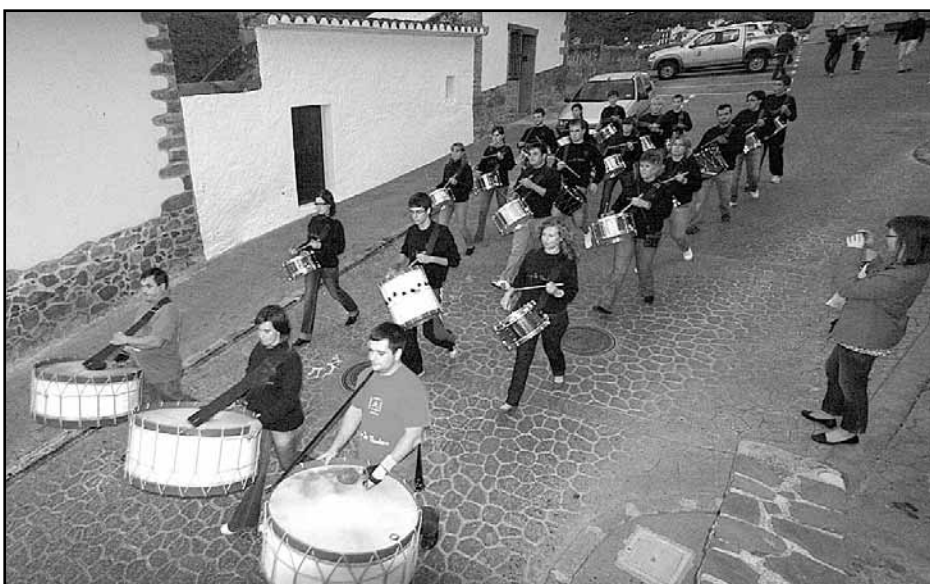
Grupo de tambores de Vilafamés

partir prestos para recoger a sus costillas, con la advertencia meteorológica de unos Cúmulus Límibus amenazantes, que señalaban lluvia del mismo modo que lo hacían las "oronetes de roca", signos inequívocos todos ellos de que igual podía llover como no. Según se fueron congregando los romeros, unos que subieron a pie, otros que solo hicieron un recorrido corto a pie y algunos que llegaron a la puerta de la ermita motorizados, se acercaba el momento de la paella. Raciones para 300 comensales se repartieron para dar buena cuenta de ellas en las mesas dispuestas en el entorno de la ermita, a la sombra del arbolado o a pleno sol, que siempre va bien para calentar los huesos y los corazones. La jornada festiva finalizó con la celebración de una solemne misa en honor a Sant Miquel y la actuación del Grup de Tambors de la Asociación Amics de Sant Miquel, que de igual modo que abrieron el programa, se encargaron de cerrarlo también. Hasta el año que viene.