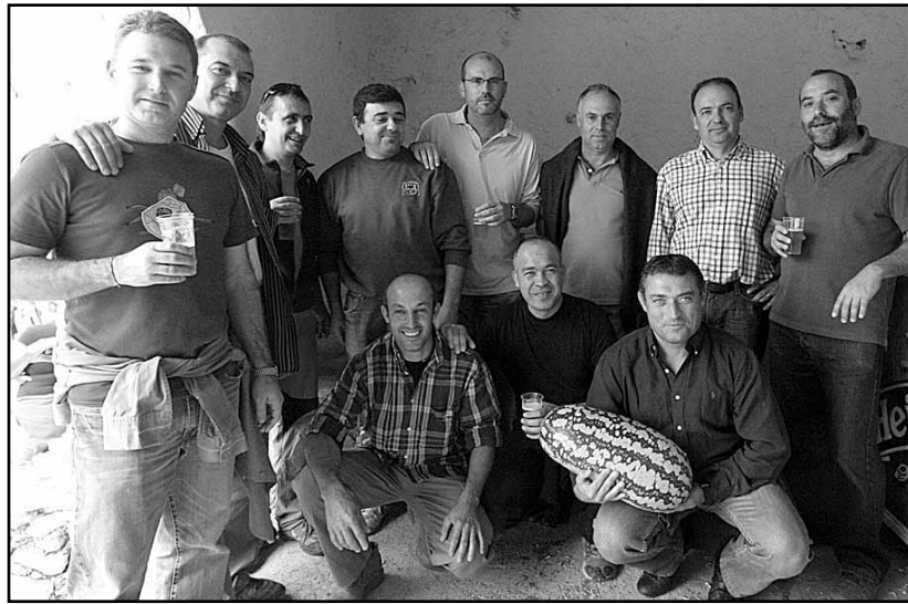
Els melons de Sant Miquel