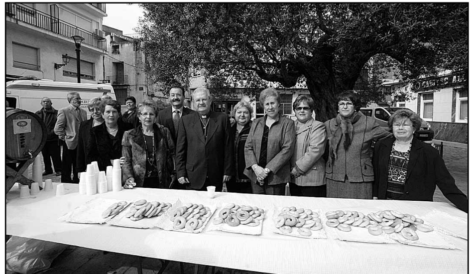
Las Amas de casa de Alcalà junto al obispo de Tortosa y al Alcalde de la localidad