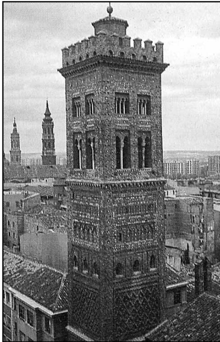
Santa María Magdalena

a Zaragoza a animar al Apóstol Santiago que estaba predicando el Evangelio. Trajo consigo un pilar para que se construyera sobre el una capilla, el primer templo mariano de toda la Cristianidad.