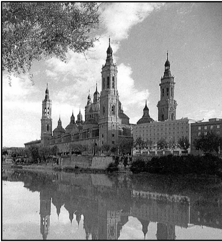
Basilica del Pilar

Nuestro primer recorrido nos ha llevado al Monasterio de Piedra y a las ciudades mudéjares de Calatayud y Daroca.