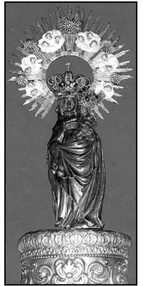
La Virgen del Pilar