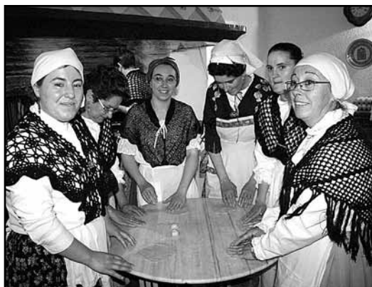
Orelletes, formatge y codonyat