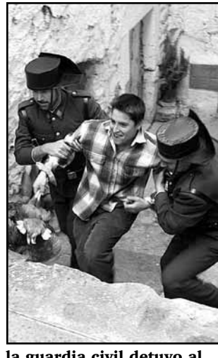
la guardia civil detuvo al ladrón de las gallinas