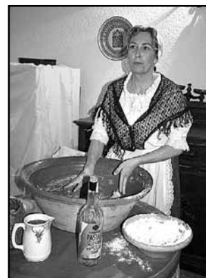
Orelletes, formatge y codonyat