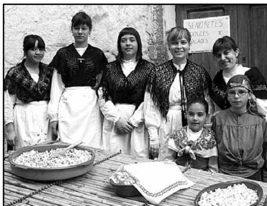
"senyorettes" dulces y saladas