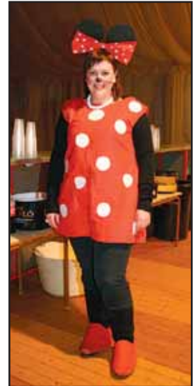
El jueves 7 de mayo se celebró un gran Baile de disfraces, en el que la imaginación llenó las fiestas de mayo de la localidad. Muchos fueron los vecinos de Cabanes que se presentaron en el baile ataviados con divertidas indumentarias, que compitieron en originalidad y colorido.