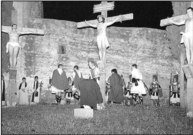
TORREBLANCA EL 7 SET

El Jueves Santo el pueblo pone en escena un año más la representación