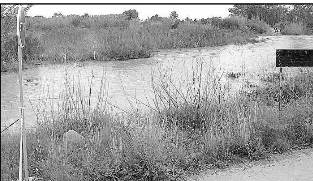
Coast road to Torrenostra