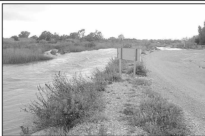
Cap i Corp Lagoon