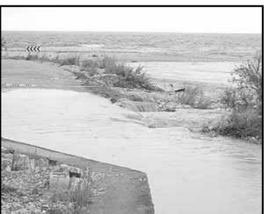
Cap i Corp Lagoon

Once again we are beside the San Miguel River today, April 29th 2007, flowing fast, which is very confusing to those wishing to reach Torrenostra or Alcossebre, especially by bike! Cap i Corp, Resident.